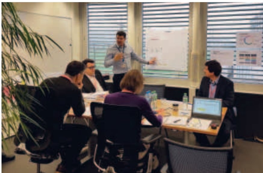
Rapporto della commissione Ostral sulla situazione.

All'organizzazione Ostral insieme alle segnalazioni sono anche pervenute diverse domande per esempio sull'attuazione tecnica di misure di gestione regolamentata o su condizioni legali valide durante una fase di gestione regolamentata. Si sono inoltre affrontati gli argomenti di interfaccia rispetto ad altri settori specializzati dell'ap-